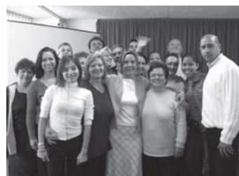
gruppo di un corso di formazione sul counselling cristiano