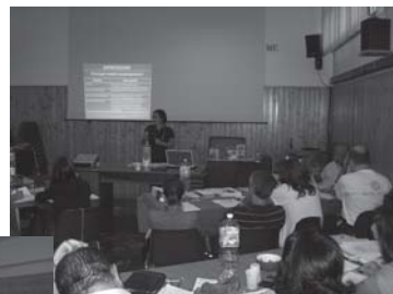
corso di formazione a Milano