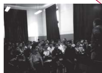
prevenzione nelle scuole