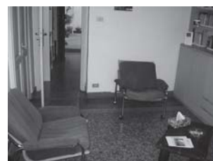
saletta per il counselling