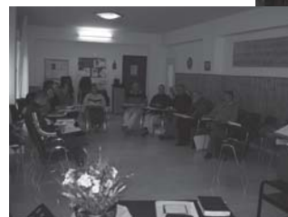
corso di formazione a Nicosia