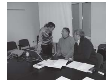
corsi di formazione sulle dipendenze in Slovenia