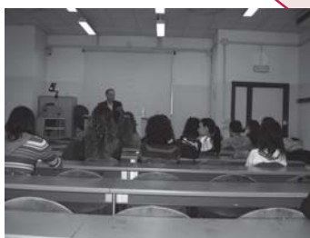
conferenza all'Università di Firenze con i GBU