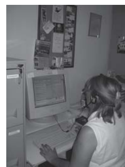
counselling telefonico e via e-mail