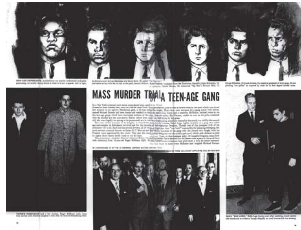
La pagina di "Life" che attirò l'attenzione di Wilkerson

Teen Challenge lavora anche in molti altri paesi nel mondo, tra cui l'Italia, ma di questo ne parleremo nel prossimo numero.