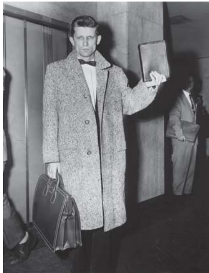
Wilkerson fotografato al processo mentre mostra la Bibbia

David Wilkerson, un pastore evangelico americano che si prendeva cura di una piccola chiesa evangelica di campagna, fu colpito da un articolo della rivista Life del 24 febbraio 1958 vedendo la espressione degli occhi di alcuni adolescenti implicati in un caso di omicidio a New York. Nel tentativo di fornire loro una qualche forma di assistenza spirituale, si trovò per la prima volta proiettato nella situazione di degrado, abbandono, droga e violenza delle bande adolescenziali di New York.